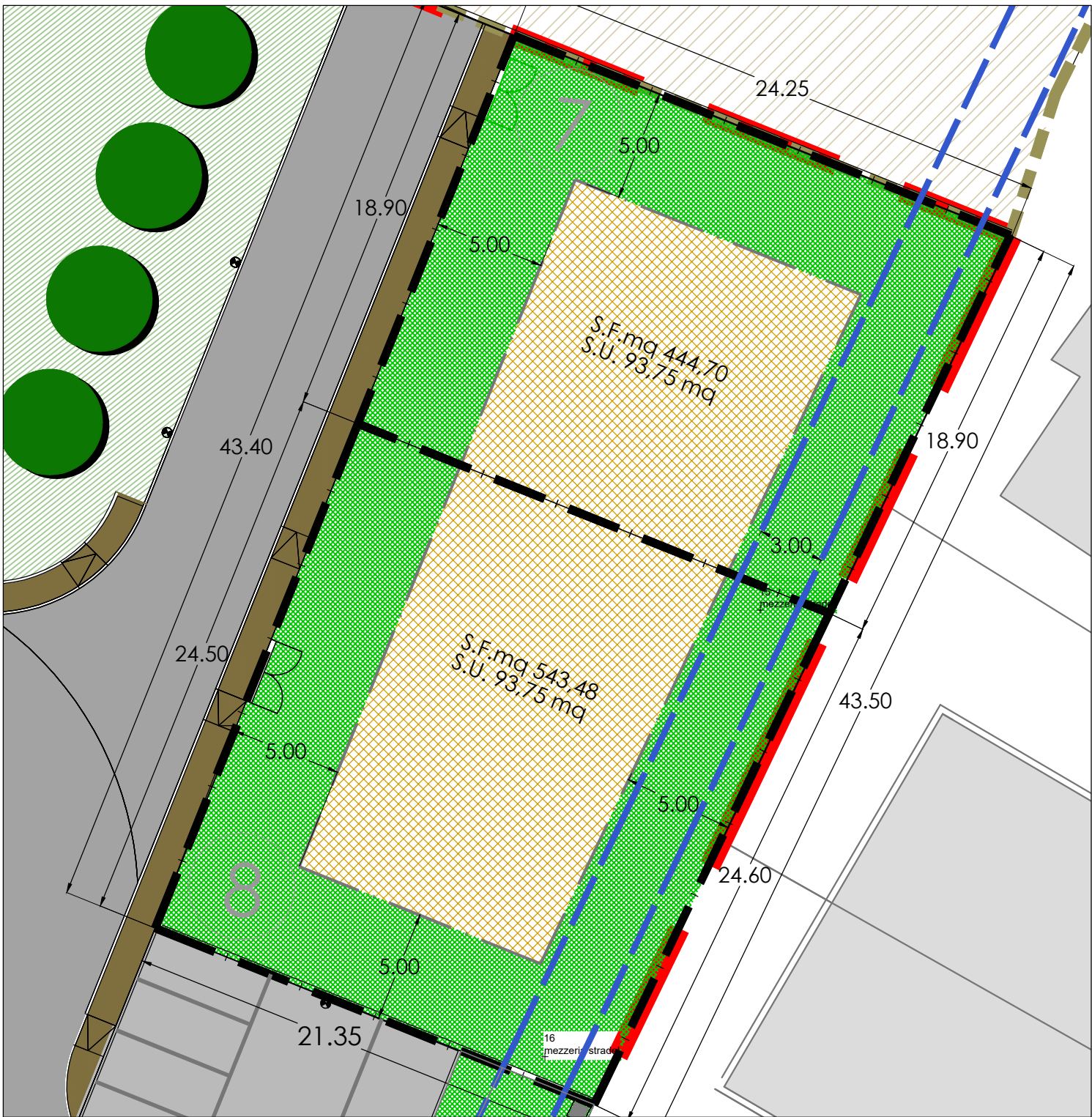
PLANIMETRIA LOTTI 7-8