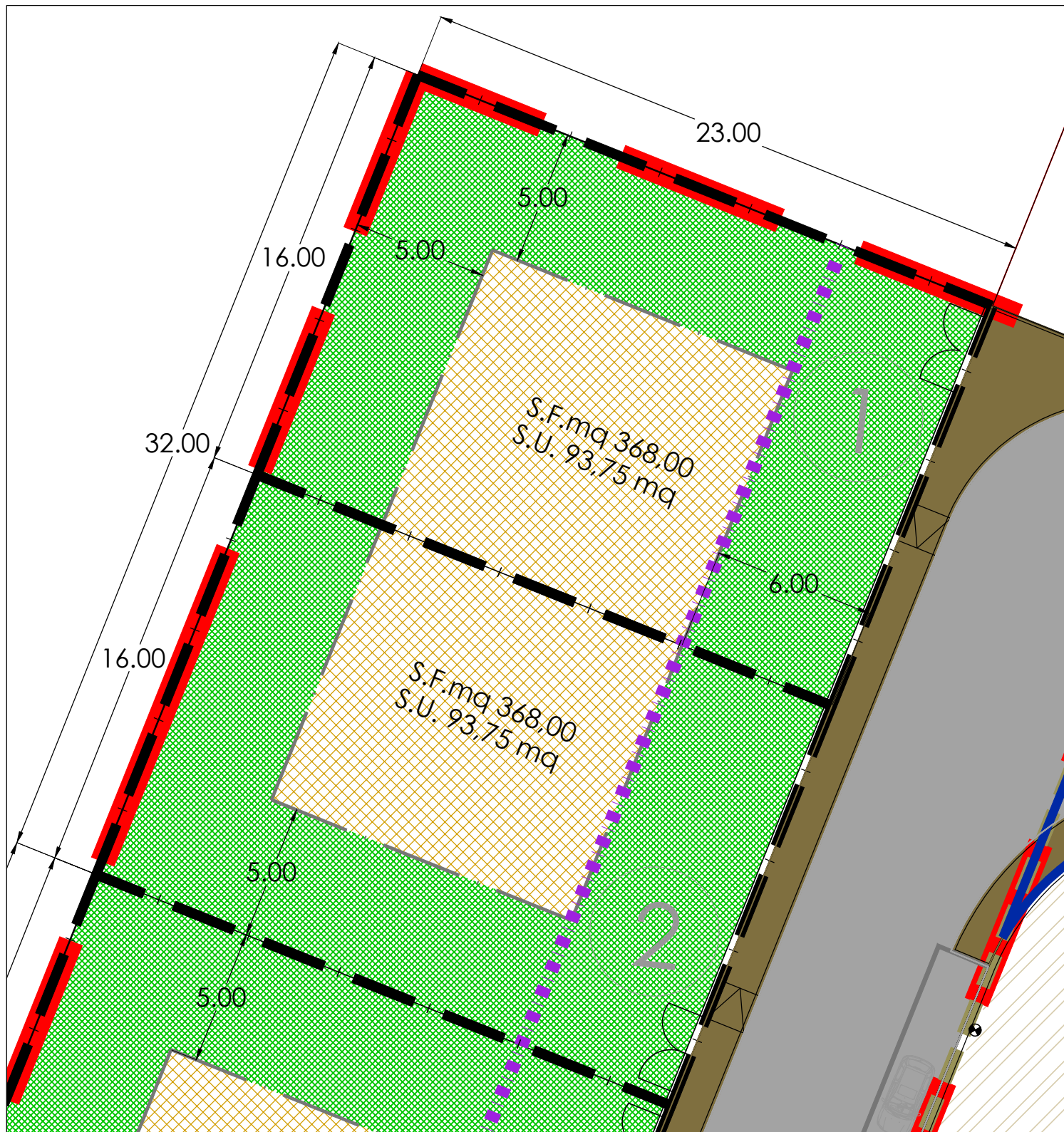
PLANIMETRIA LOTTI 1-2