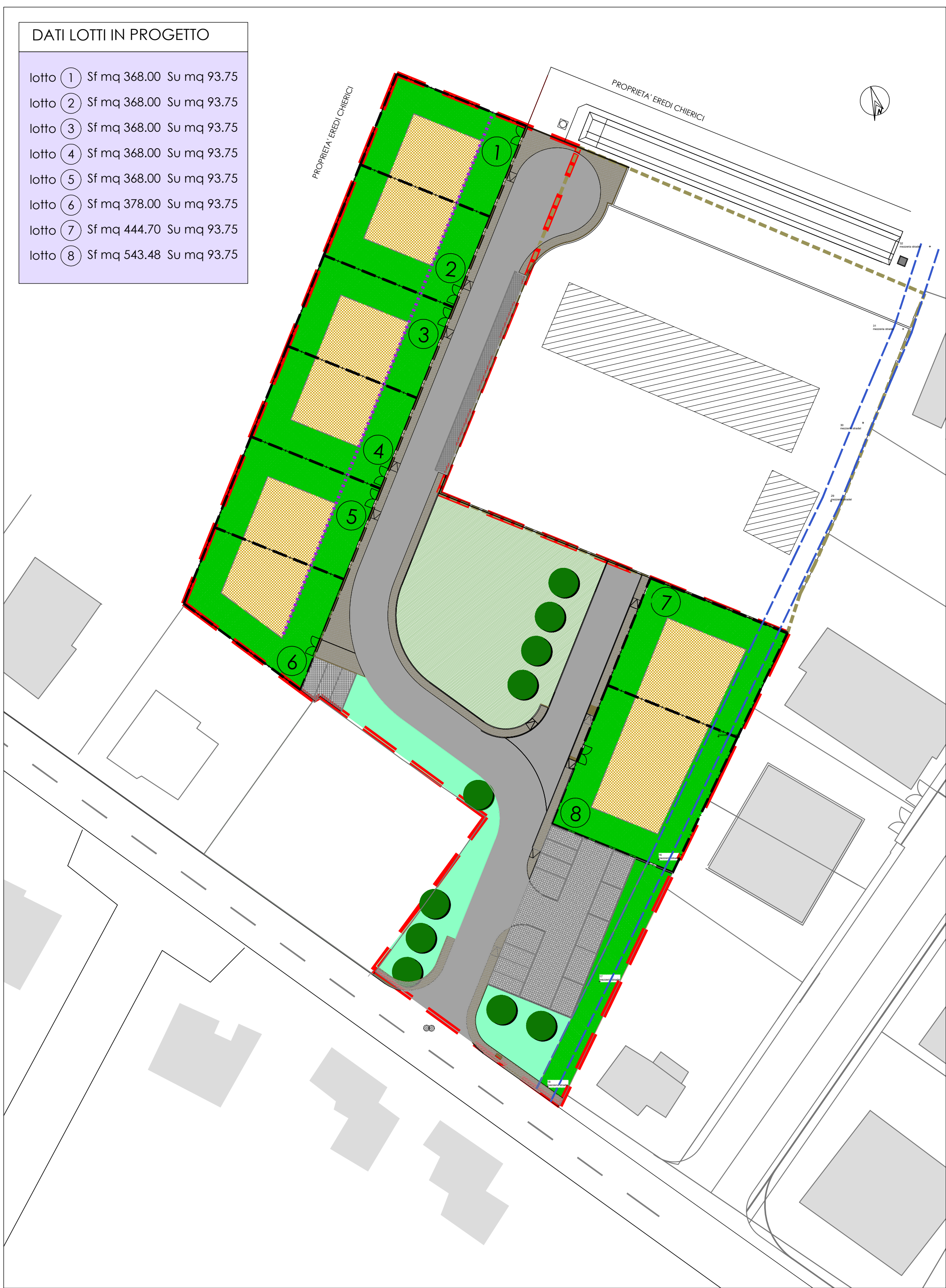
PLANIMETRIA GENERALE DI PROGETTO